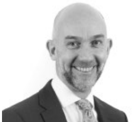
Adrian Crompton Archwilydd Cyffredinol Cymru

Rwy'n ddiolchgar iawn i'ch swyddogion am eu cymorth wrth gynnal yr archwiliad hwn.